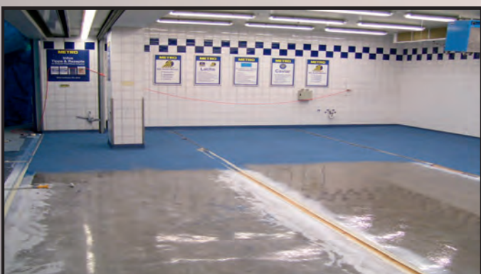
Mehrfarbige Einstreubeläge für Verkaufsflächen, Großküchen, Produktions- und Lagerflächen, je nach Nutzung erfolgt der Einsatz der Bindemittel auf Epoxidharz, Polyurethan- oder Meth-Acrylatbasis, einfarbige Strukturbeschichtung mit leicht zu reinigender Oberfläche für Rampen und Fahrwege