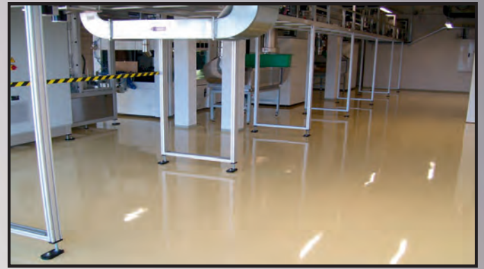
Labor- und Produktionsböden mit Reinraumanforderungen, glänzende und matte Oberflächen, ableitfähig, mehrfarbig, mit und ohne Einbauten, fachgerechten hochwertigen Hohlkehlen bis 12cm, chemisch hoch belastbar