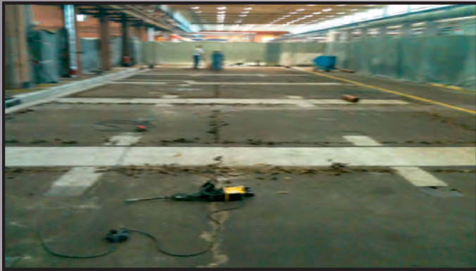
Sanierung von stark verschlissenen, ölverseuchten Untergründen im Rahmen einer Nutzungsänderung für moderne Werkzeugfertigung mit rutschhemmender heller Produktionsfläche und dunklem Fahrweg