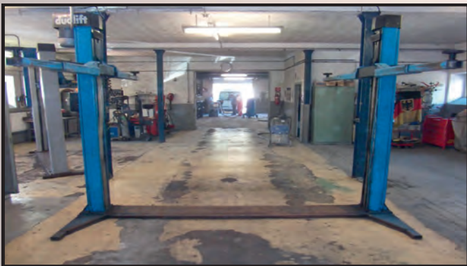
Bestandsboden aus Altbeschichtungen, Pflaster-, Klinker- und Betonboden durch Rückbau und mehrlagige Neubeschichtung unter Berücksichtigung der Kundenwünsche