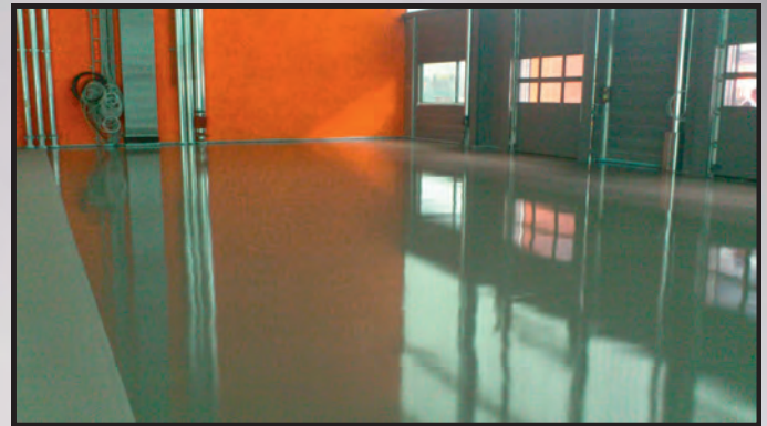
Hochregallagerböden gemäß DIN 15185, für hohe Rollbelastungen, antistatisch, fugenlos, diffusionsoffen