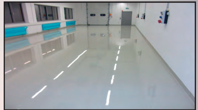
Epoxidharzbeschichtung als strapazierfähige, flexibel einsetzbare farbige Nutzflächen, hygienisch, emissionsarm als ESD- Böden mit zusätzlichen Schichtaufbauten, geprüfte Einstellung von Rutschhemmklassen von R9 bis R13