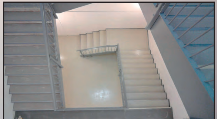
Verkaufsflächen in modernen Farbtönen, matt und glänzende Ausführung, fugenlose Böden, rutschsichere Treppenhausböden mit integrierten Kantenschutzprofilen, Einbau und Anpassen von Fugenprofilen, Beschichtung von Traforäumen und Technikbereichen