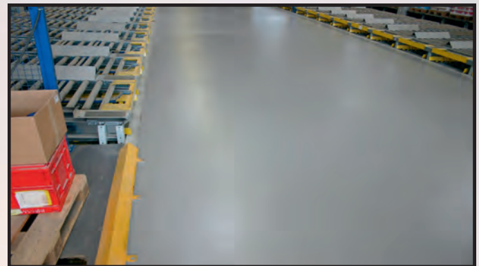
Produktions- und Lagerflächen, nicht brennbar, öl- und wasserbeständig, regenerativ, umweltschonend, zukunftsweisend