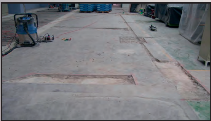
Stark geschädigter Betonboden mit Instandsetzung der Tragplatte und Glattbeschichtung auf Basis von lösemittelfreien Epoxidharz und zementgebundenen Beschichtungen, im Anschluss mit farbigem Wasserglas vergütet