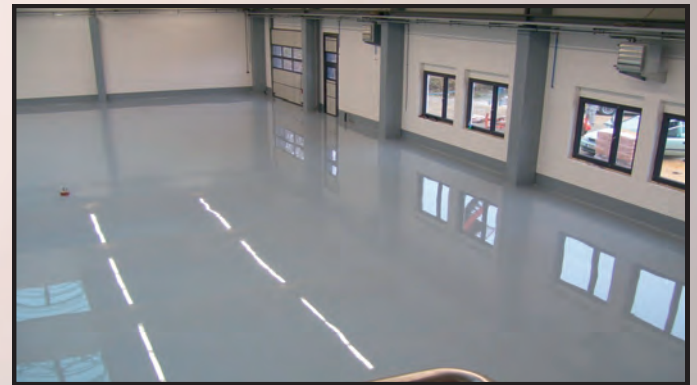
AgBB geprüfter Bodenaufbau mit integrierten Trittschallmatten, UV-stabiler Polyurethanbeschichtung für Schulen, Kindergärten, Büro- und Aufenthaltsräume, Behindertenwerkstätten, Speisesäle, Museen und modernen Loftböden